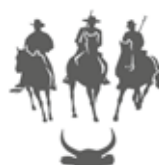
Équitation de travail