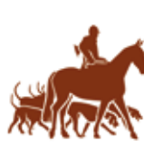
Cheval de chasse